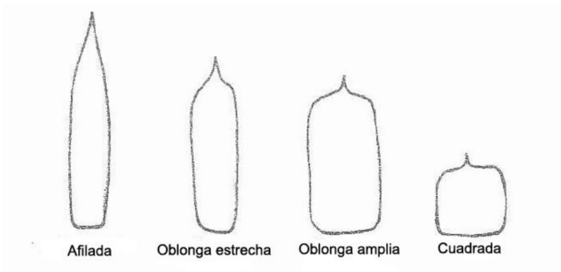
Figura 2. Forma de la capsula.