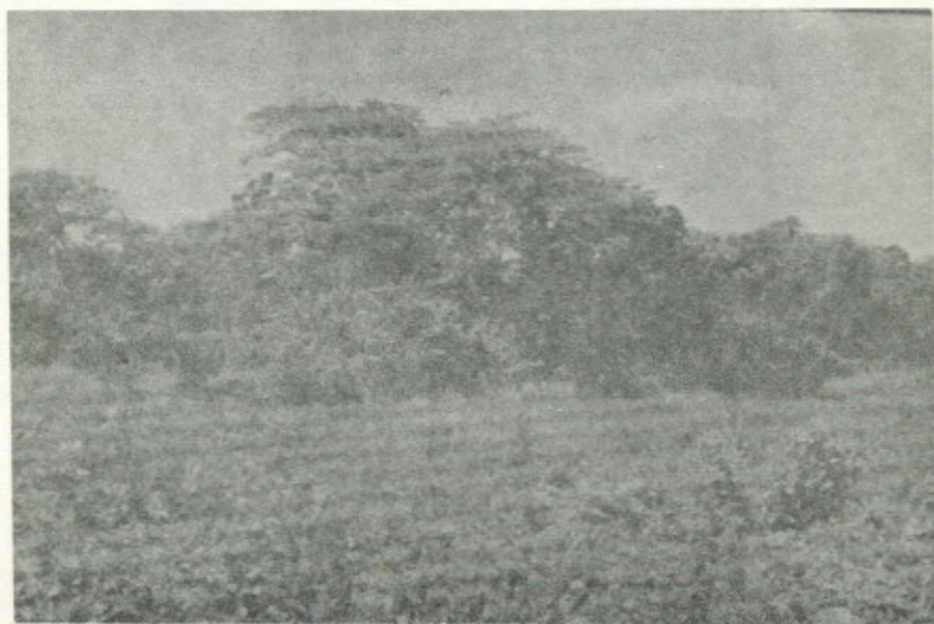
Fotografía No. 6.—Vista representativa de las áreas forestales de la zona estudiada. Obsérvese el crecimiento denso y alto de la vegetación.