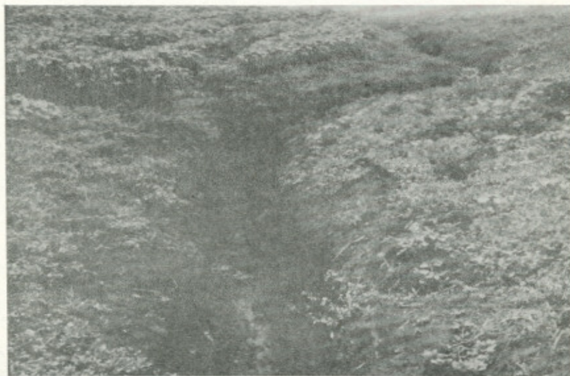
Fotografía No. 4.—Vista detallada de la clase de tierra IV con cárcavas de más de 50 centímetros de profundidad. Nótese el horizonte "B" al fondo de la cárcava y los surcos de algodón a lo largo de la pendiente.