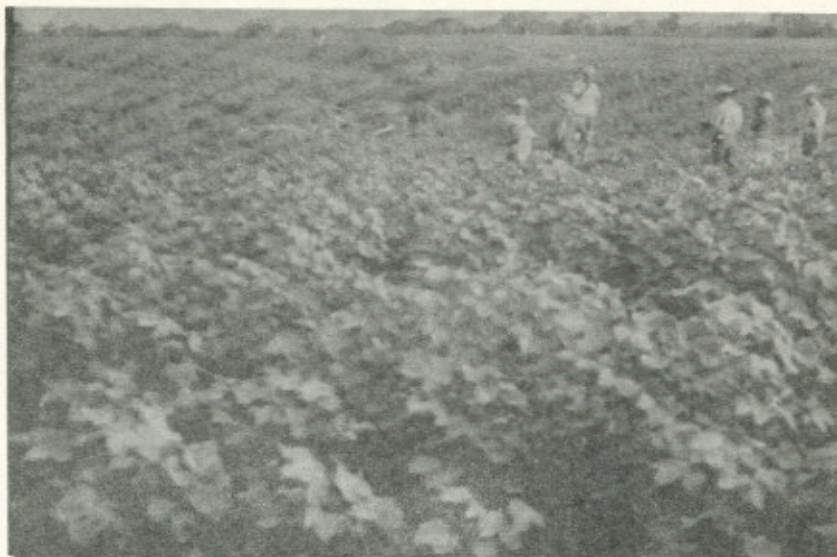
Fotografía No. 3.—Clase de capacidad de tierra III al frente y IV al fondo. Obsérvese los surcos de algodón a lo largo de la pendiente en ambas clases, que ya han producido fuerte erosión por cárcavas en la Clase IV.