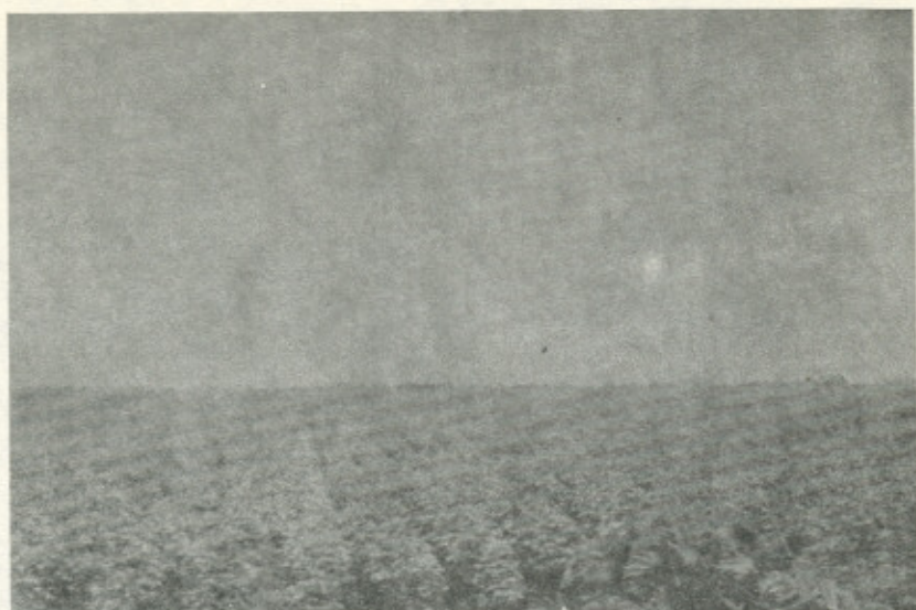
Fotografía No. 1.—Clase de capacidad de tierra II con algodón. Obsérvese la siembra del algodón en surcos a lo largo de la pendiente.