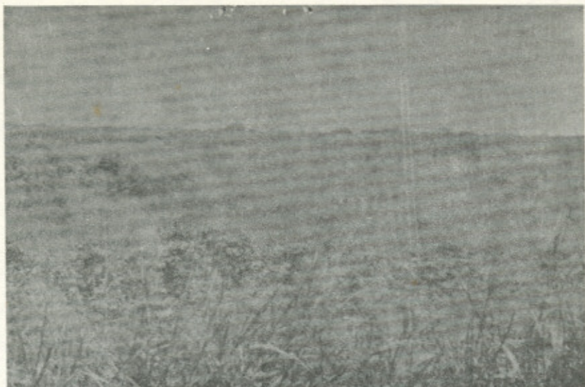
Fotografía No. 5.—Clase de capacidad de tierra II en pastos cultivados y naturales. La estructura de estos suelos no ha sido degradada en lo relativo a su tamaño y grado de desarrollo. Se pudo observar cierto grado de compactación ocasionado por el pisoteo del ganado.