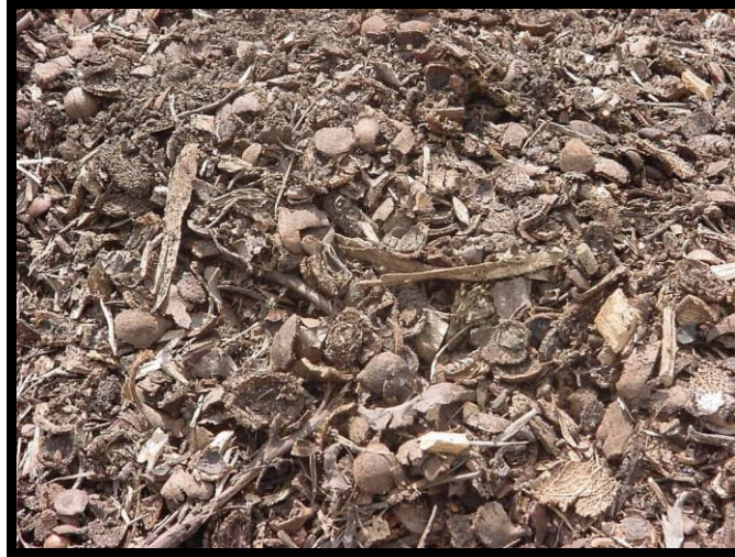
Figura 3 . Alimento mezclado y preparado para las lombrices.

De la misma manera como se elaboran los lechos, el alimento lleva el mismo proceso y se les ofrece a las lombrices hasta que ha sufrido cierto grado de descomposición. La lombriz tiene la capacidad de transformar, casi cualquier desecho orgánico sin previa descomposición; sin embargo es recomendable proporcionarle el material que va a transformar con cierto grado de descomposición para acelerar la producción de humus.