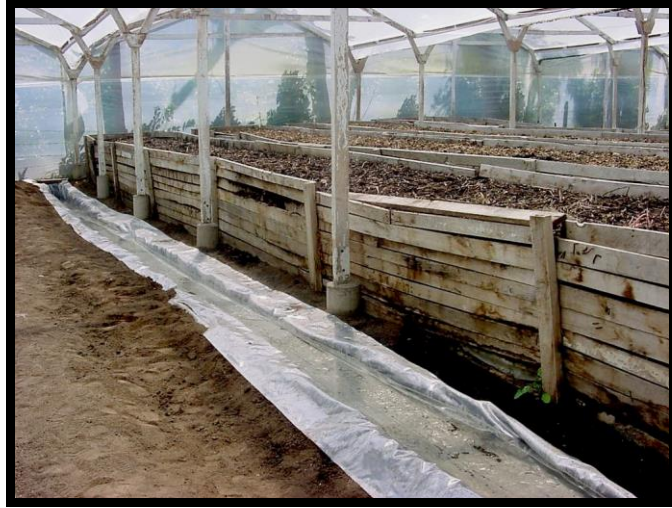
Figura 6. Trampa de agua a nivel del piso y alrededor de los lombrizarios (cajones).