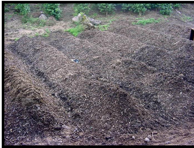
Figura 2 . Camellones de material usado como lecho.

veces por semana, tratando de mantener la humedad elevada para favorecer la descomposición y evitar que la temperatura aumente. Una vez por semana, se les da vuelta a los camellones con el fin de ventilarlos y de no permitir que se eleve la temperatura. El número de veces que se les debe dar vuelta a los camellones y que se les debe regar, depende de la temperatura que alcancen los mismos, no se debe permitir que la temperatura sobrepase los 50 °C, para que la materia orgánica no se convierta en cenizas.