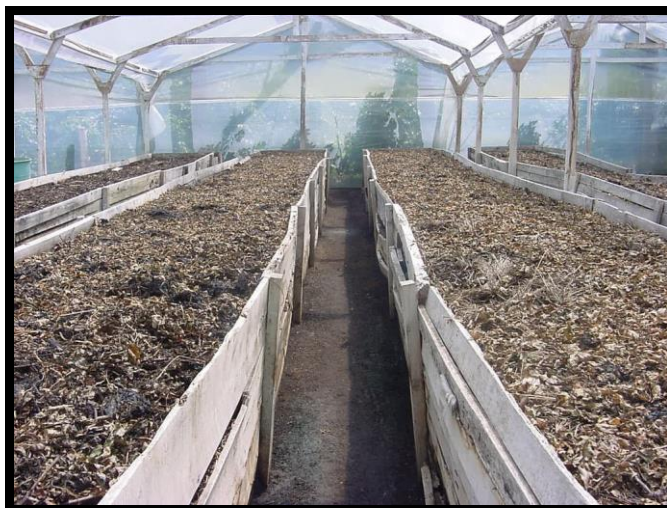
Figura 1. Lombrizarios en Finca San Sebastián.

Los cajones poseen una pendiente del 1%, para facilitar el drenaje del agua y en su parte mas baja, poseen un depósito para recibir este efluente rico en ácidos húmicos y microorganismos benéficos, que después son utilizadas en aplicaciones foliares en las Rosas o como acelerantes en la descomposición de materia orgánica.