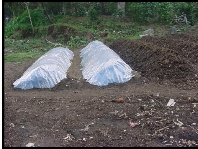
Figura 5. Solarización de los camellones de alimento de la lombriz.